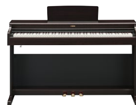
YDP-165 R B WA WH