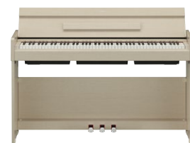
YDP-S35 B WA WH