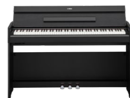
YDP-S55 B WH