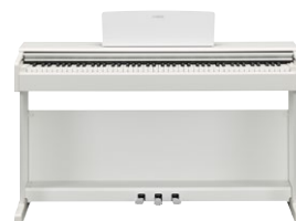
YDP-145 R B WH