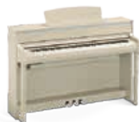
CLP-675WA Frêne clair