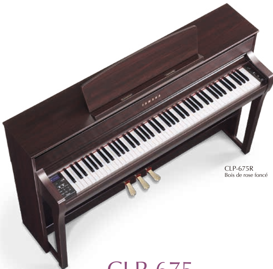
CLP-675R Bois de rose foncé