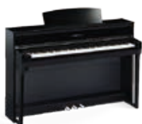
CLP-675PE Laqué Noir

La nouvelle génération de clavier GrandTouch et un système d'amplification à trois voies, pour obtenir les mêmes sensations de jeu que sur un piano à queue.