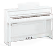
CLP-675WH Blanc mat