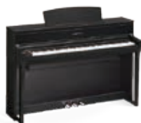
CLP-675B Noyer noir