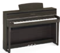
CLP-675DW Noyer foncé