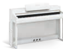
CSP-150WH Blanc mat