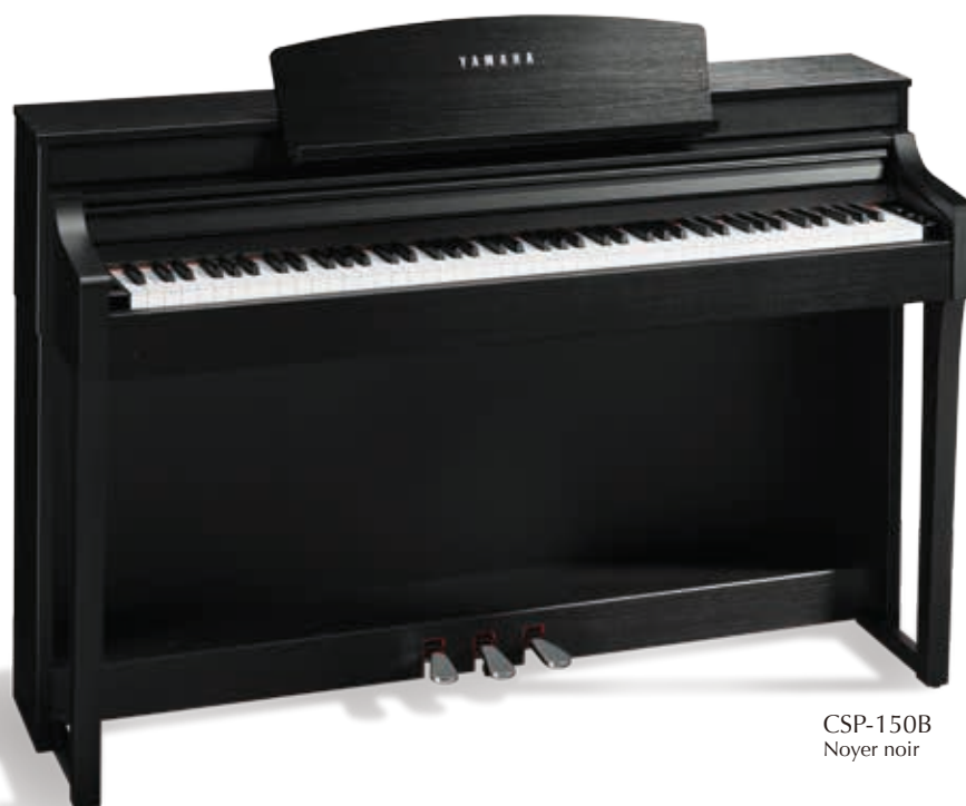
CSP-150B Noyer noir