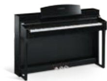
CSP-150PE Laqué noir

Progresser sans peine grâce à ce nouveau modèle, développé afin de répondre parfaitement à vos désirs. Utilisez-le conjointement avec l'application Smart Pianist et apprenez facilement à interpréter vos morceaux favoris.